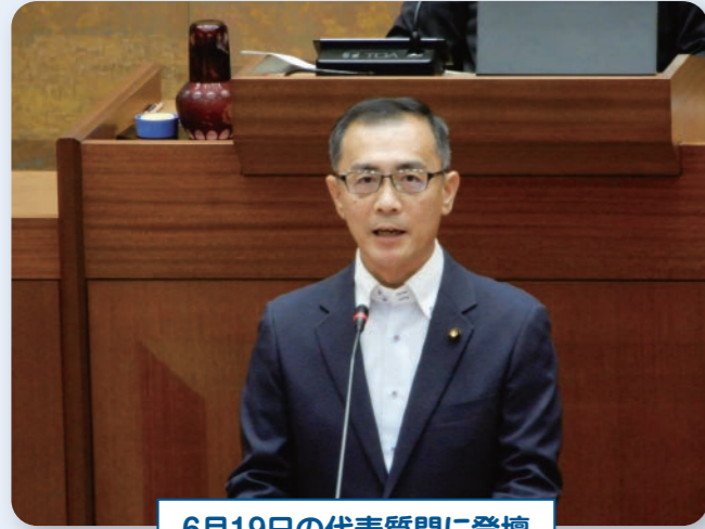
6月19日の代表質問に登壇